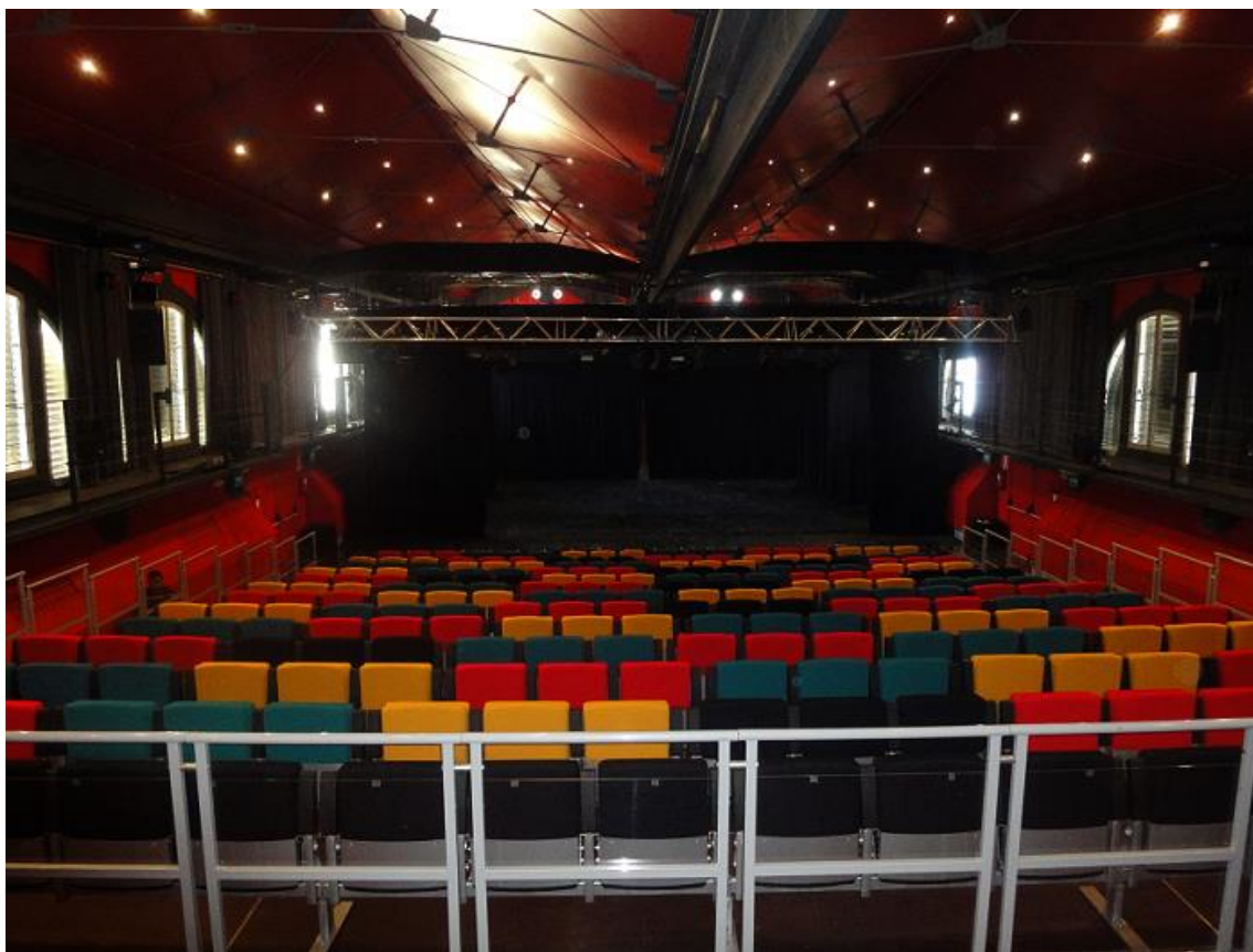
Vista desde escenario